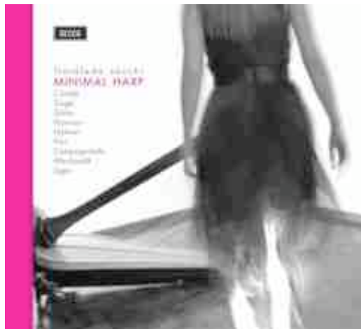
Minimal Harp , un CD frutto del progetto di Floraleda Sacchi.