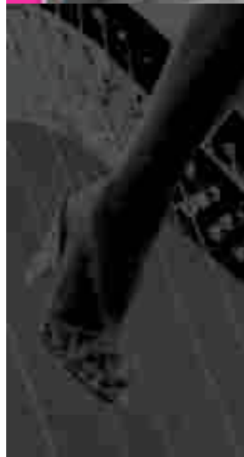
Immagine in quarta di copertina del libretto.